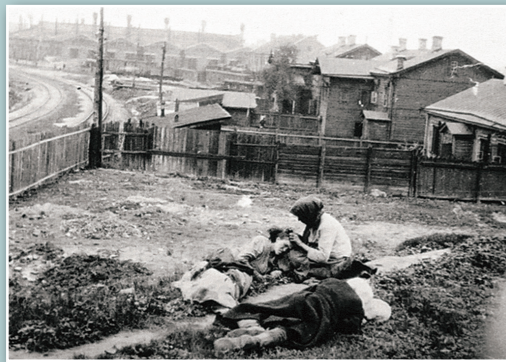
Opfer der Hungersnot im Gebiet Charkiw, 1933

Während der frühen dreißiger Jahre wurde die Kollektivierung der ukrainischen Dörfer abgeschlossen und die Bevölkerung gewaltsam in Kollektivwirtschaften, Kolchosen, getrieben. Diese Politik bewirkte, dass die Landwirte und Bauern völlig abhängig von staatlichen Subventionen wurden. Durch Massendeportationen und Repressalien gelang es den Kommunisten, die reichen unabhängigen Grundbesitzer, die Kulaken, auszuschalten, die den Keim einer Nationalbewegung hätten bilden können. Doch selbst nach dieser Zeit der Unterdrückung dauerten örtliche antisowjetische Aufstände noch an. Um die Widerstandsbewegung endgültig zu zerstören, beschloss der Staat, die feindseligen Bauern mit einer Hungersnot zu bestrafen.