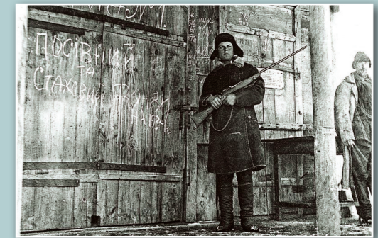
Bewaffneter Posten in einem Getreidespeicher im Dorf Wilshany im Gebiet Charkiw

Sie erhielt eine Lebensmittelration, die sie und ihre Familie vor dem Hungertod bewahrte. Aber die Zuteilung, die sie vom Staat erhielt, konnte sie nicht von dem Schrecken abschotten, der sie umgab. Sich abzuschotten war schwer,