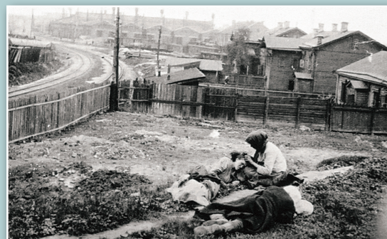
Oběti hladomoru, Charkovská oblast, 1933

Začátkem 30. let byla dokončena kolektivizace ukrajinského venkova a obyvatelé byli přinuceni vstoupit do zemědělských družstev. V důsledku této politiky se sedláci a zemědělci stali plně závislími na vládních dotacích. Prostřednictvím masových deportací a represí se komunistům dále podařilo zlikvidovat zámožné a nezávislé majitele půdy – kulaky, kteří mohli stát u zrodu národního hnutí. Místní protisovětské vzpoury však pokračovaly i po tomto období represí, a tak se sovětská vláda rozhodla potrestat nespolupracující zemědělce vyhladověním. Hnutí odporu tak mělo být definitivně zničeno.