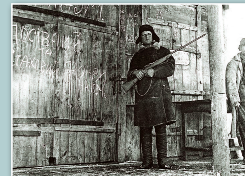
Ozbrojená stráž před skladem obilí, vesnice Vilšany, Charkovská oblast

Měla přiděl jídla, což pomohlo jí i ostatním členům její rodiny přežít. Ani přiděl, který dostávala od státu, jí však nemohl zavřít oči před hrůzami, které byly všude kolem. Nevšímat si okolí pro ni bylo prakticky nemožné, protože jako učitelka se musela každý den dívat do očí hladovějících dětí a sledovat, jak jejich řady stále řídnu.